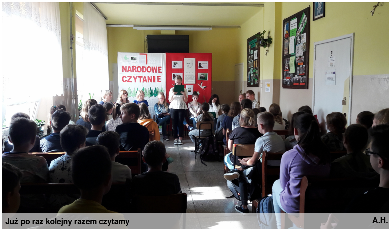
Już po raz kolejny razem czytamy